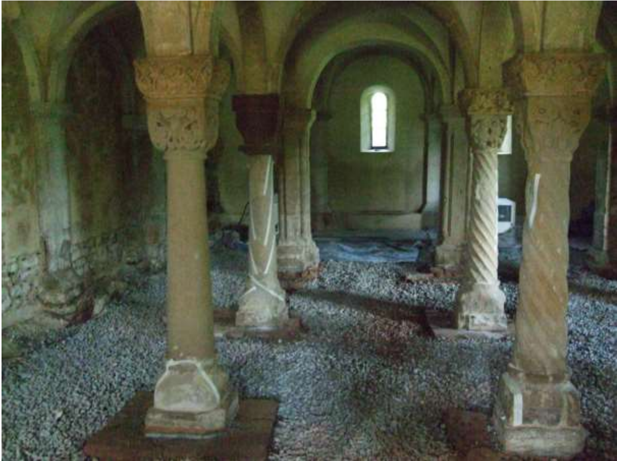
Abb. 24: Säulen in der Krypta der Konradsburg des ehemaligen Benediktinerklosters Ermsleben