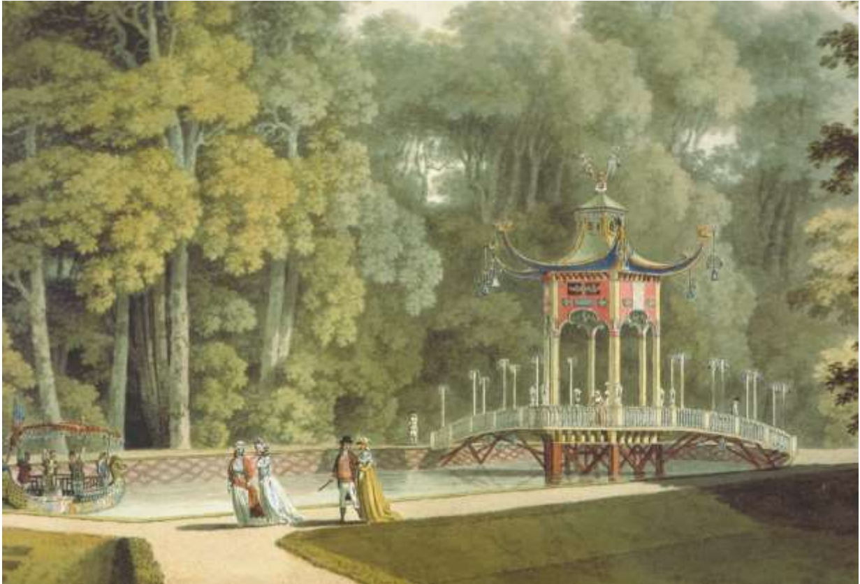
Abb. 12: Lorenz Janscha: Chinesischer Pavillon in Laxenburg (Aquarell, um 1800)

Albertina Wien, Inv.-Nr. 6907, Ö. XVIII, Jh. Bd. 16/1, aus: Hajós 2006, Abb. 133 (Anm. 28)