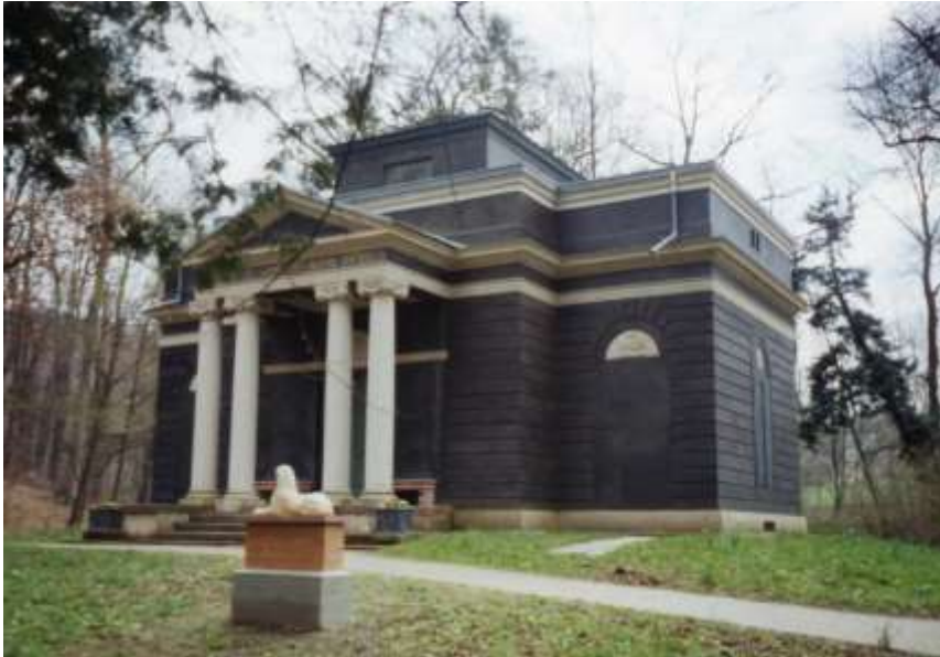
Abb . 5: Badehaus im Park Greenfield zu Waldenburg