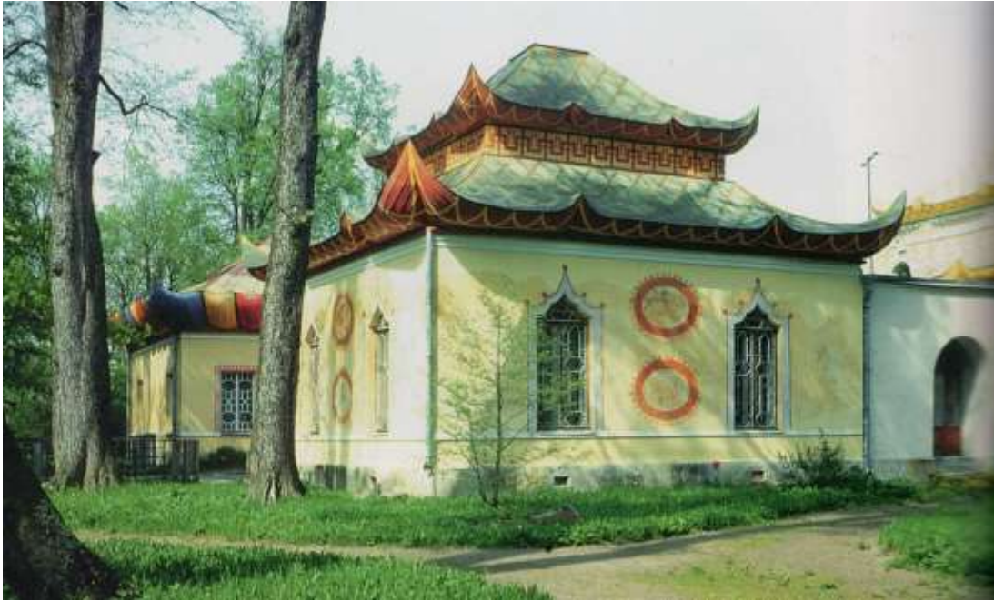
Abb . 10: Das „Hameau chinois“ in Zarskoje Selo