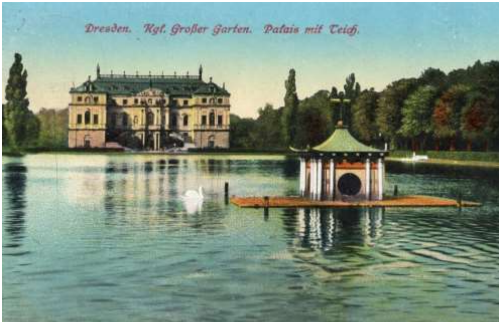
Abb. 17: Chinesisches Schwanenhäuschen im Teich vor dem Palais im Großen Garten zu Dresden (Postkarte 1912)