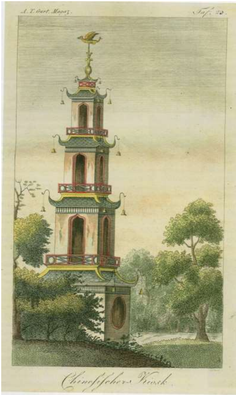
Abb. 21: J. W. (?) Schleuen jun.: Chinesischer Kiosk (in Baur's Garten zu Altona)

Kolorierter Kupferstich, in: F(riedrich) J(ustin) B(ertuch) (Hg.): Allgemeines Teutsches Garten-Magazin. 4. Jg. IX. Stück, September 1807, Weimar 1807, Taf. 23