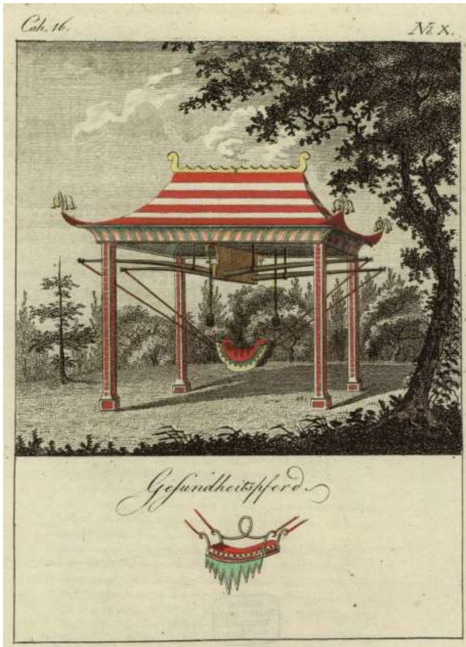
Abb. 23: Gesundheitspferd

Aus: Grohmanns „Ideenmagazin für Liebhaber von Gärten, ...“, Leipzig 1796-1806, Heft 16, No. 10