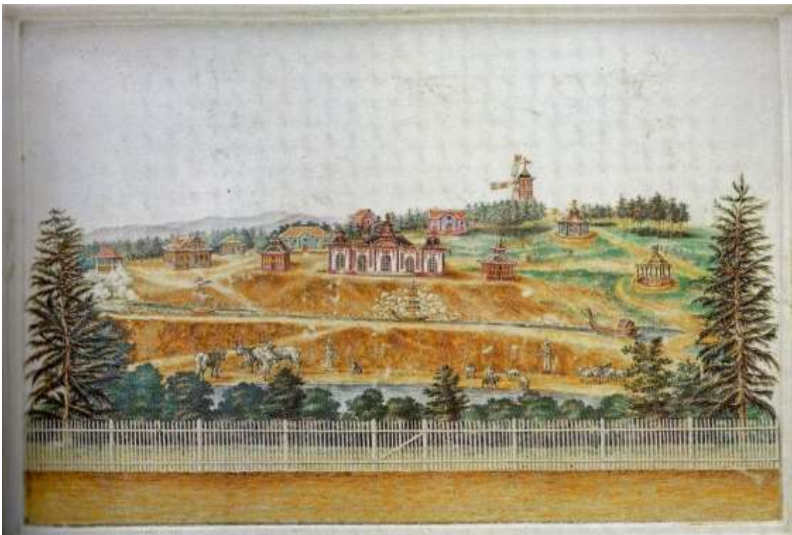
Abb. 11: J. H. Eisenträger: Tablett mit einer Ansicht des chinesischen Dorfes Mulang im Schlosspark (Kassel-)Wilhelmshöhe (1785)

Porzellan aus der Porzellanmanufaktur Kassel, Staatliche Museen Kassel, Abt. Kunsthandwerk und Plastik, Inv.-Nr. B IX/CLXI