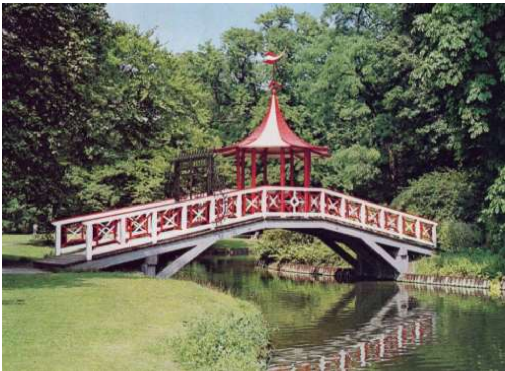
Abb. 18: Die von Andreas J. Kirkerup errichtete Brücke über den Kanal am Kinesiske Lysthus in Frederiksberg Have in Kopenhagen