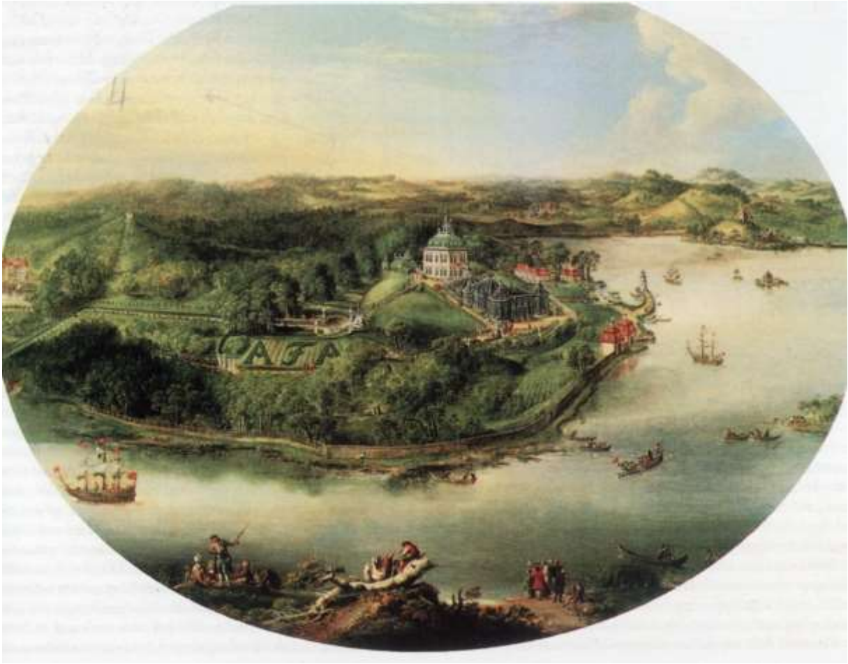
Abb. 15: Johann Christoph Malcke: Die Fasanerie beim Jagdschloss Moritzburg (ca. 1791)

Öl/Lw., 78 x 106 cm, Berlin, Deutsches Historisches Museum, Inv.-Nr. 1990/67, aus: Christoph Stölzl (Hg.): Deutsche Geschichte in Bildern, München, Berlin 1995, S. 155