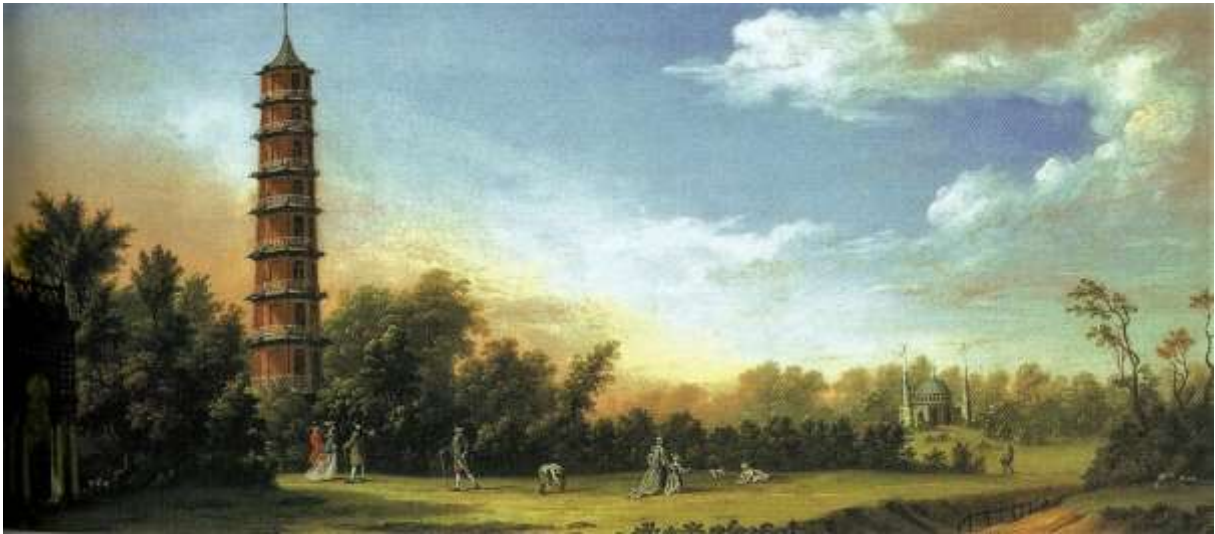
Abb. 20: William Marlow: A View of the Wilderness, with the Alhambra, the Pagoda, and the Mosque in Kew Gardens (ca. 1763-65)