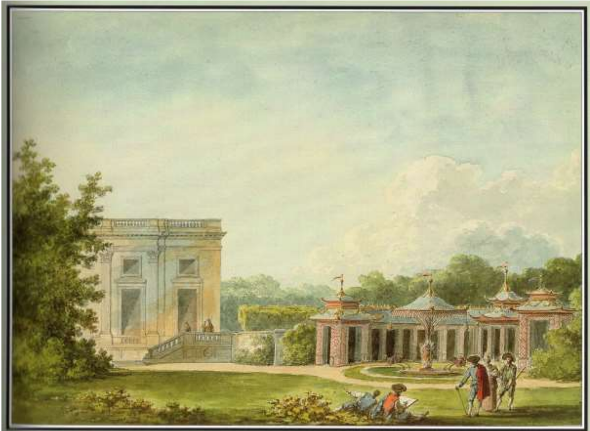
Abb. 22: Ansicht des Jeu de Bague vor der Galerie und der Fassade des Schlosses Petit Trianon in Versailles

Aquarell, 29,4 x 43,2 cm, Tafel 9 aus dem Album Petit Trianon der Biblioteca Estense, Modena, Italien