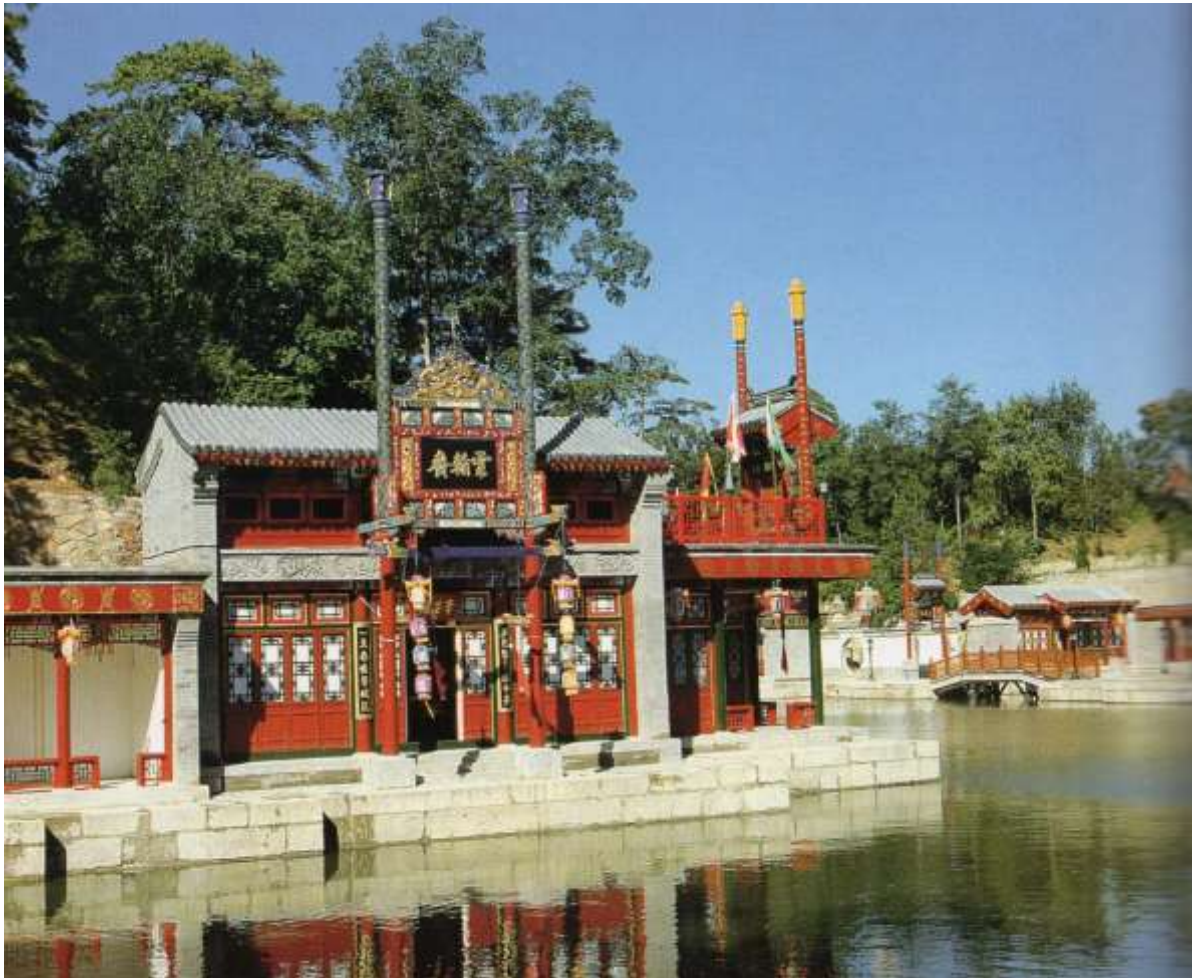
Abb. 9: Die Suzhou-Straße mit Kaufmannsläden im kaiserlichen Park des Sommerpalastes in Peking