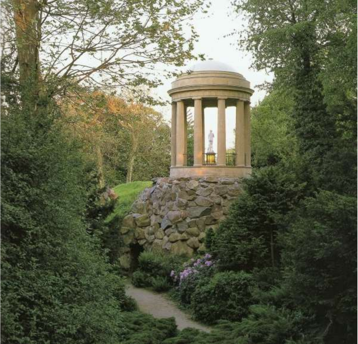
Abb. 4: Tempel der Venus im Wörlitzer Park, der 1794 nach dem Vorbild des Sibyllen-Tempels in Tivoli gestaltet wurde

Aus: John Dixon Hunt: The Picturesque Garden in Europe . London 2004, S. 161