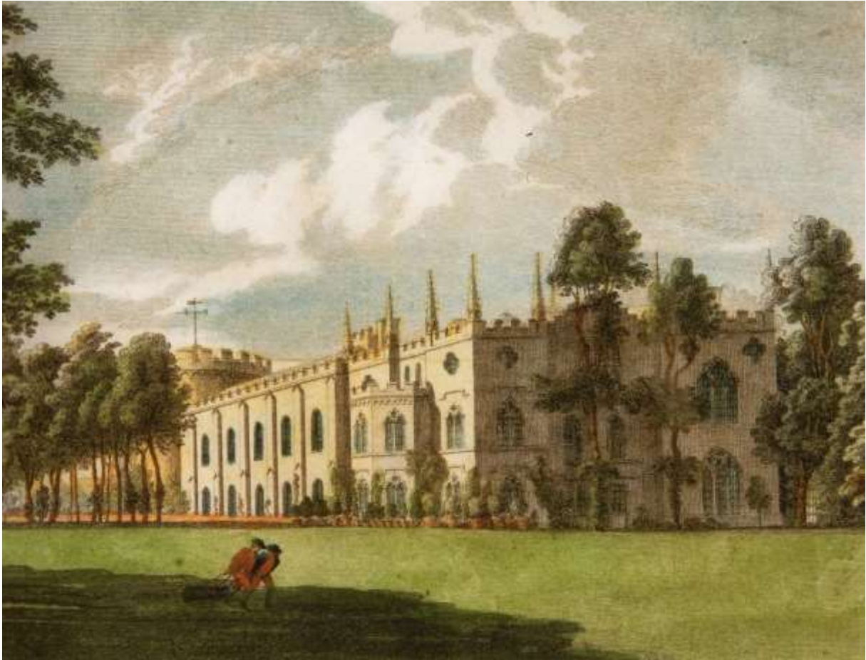
Abb. 2: Die Ostfassade von Strawberry Hill, kolorierter Kupferstich nach einem Aquarell von Paul Sandby

Aus: Chalcraft/Viscardi 2007, S. 13 (Anm. 7)