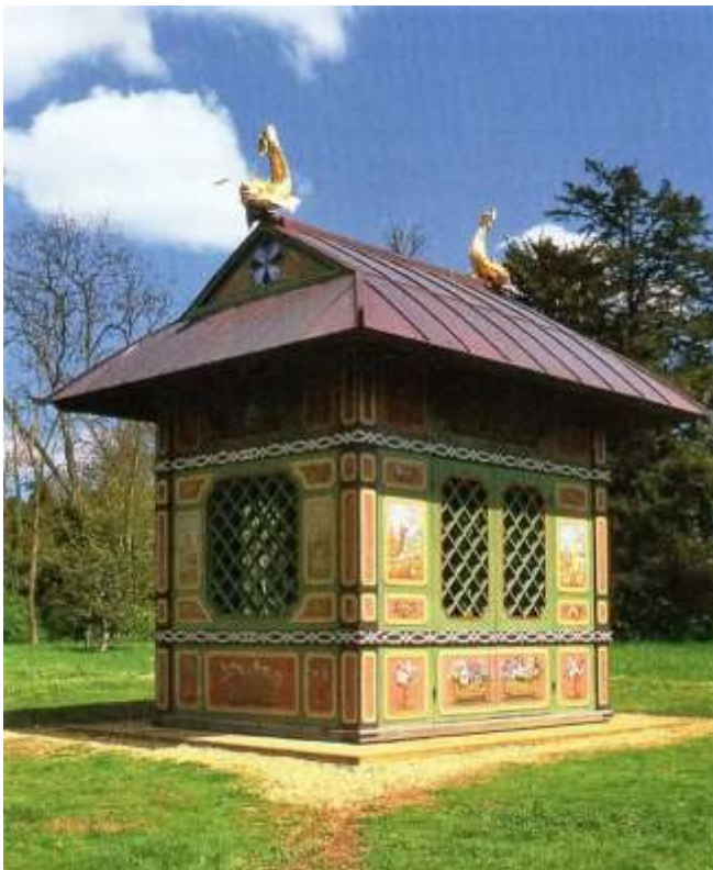
Abb. 7: Das chinesische Haus im Park zu Stowe nach dessen Wiederaufstellung