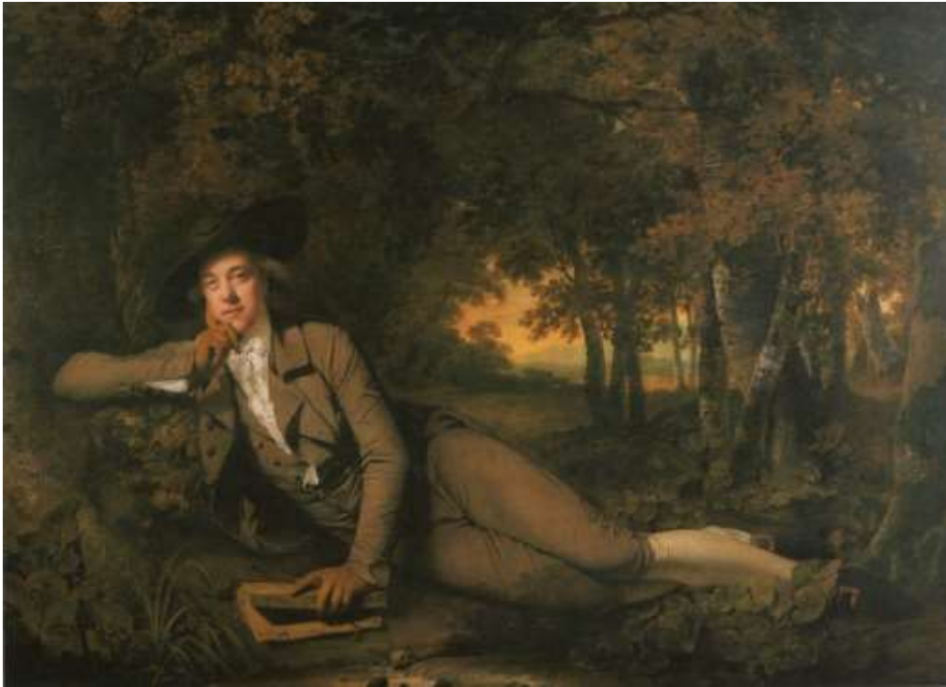
Abb. 1: Joseph Wright of Derby: Porträt des Poeten Brooke Boothby (1781)

Öl/Lw., 148,6 x 207,6 cm, Tate Gallery National Gallery London, aus: Egerton 1990, S. 116 (Anm. 2)