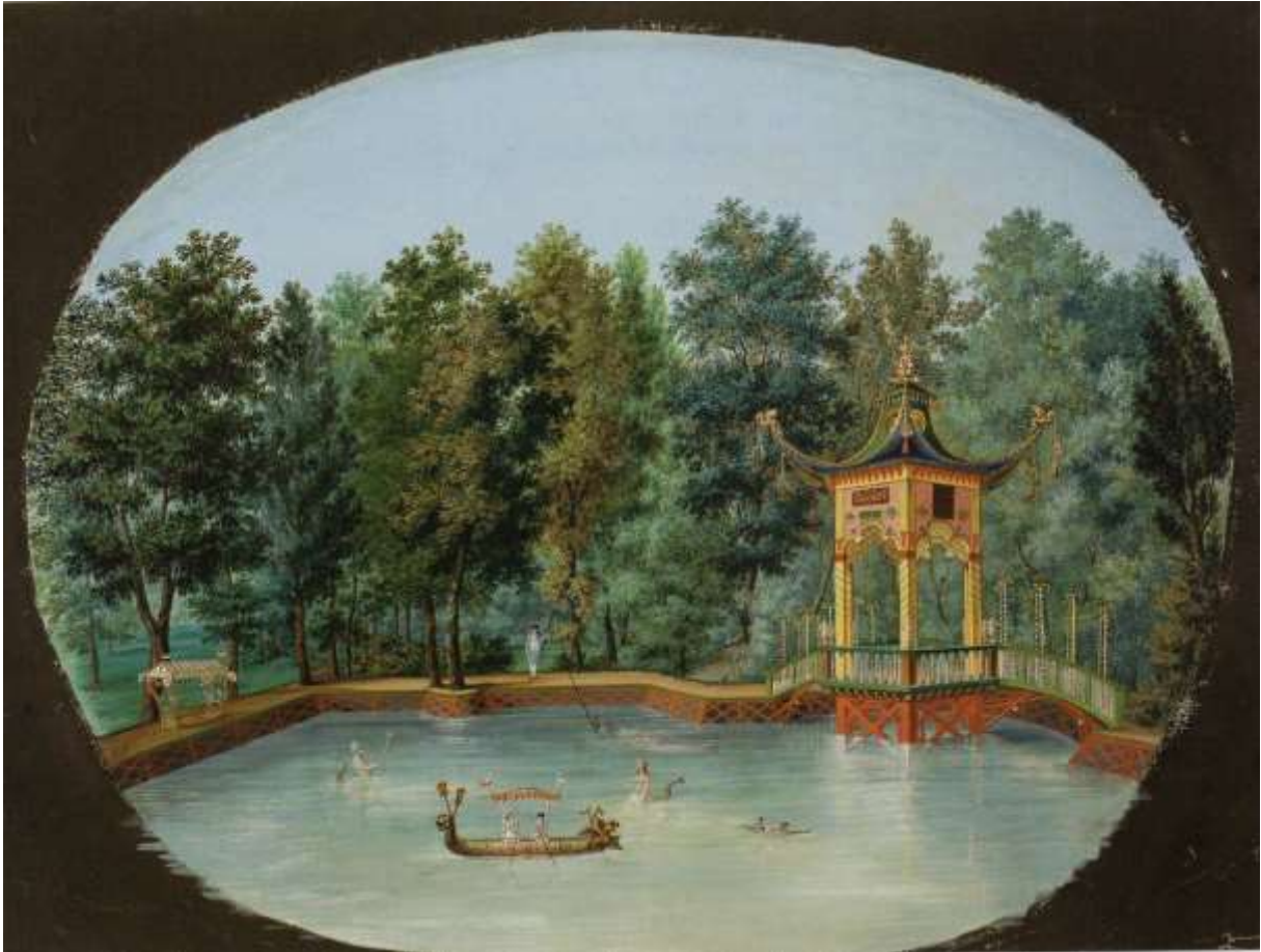
Abb. 13: Fantasieszene mit der Chinesischen Brücke in Laxenburg (Aquarell, spätes 18. Jh.)

Österreichische Nationalbibliothek, Kartensammlung, FKB Vues Laxenburg 10/a, aus: Hajós 2006, Abb. 87 (Anm. 28)