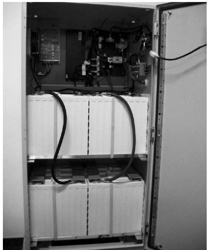
Abbildung 2: Stromspeicher der WinBat Technology GmbH im geöffneten Zustand. Im oberen Teil befindet sich die Speicherteuerung und die Leistungselektronik, darunter die Lithium-Eisenphosphat-Batterien für eine Kapazität von 15 kWh

Als Beispiel für einen Großspeicher auf Basis von Lithium-Ionen-Zellen kann der der vollautomatisierte Batteriepark der WEMAG angeführt werden, der derzeit mit dem Berliner Technologieunternehmen Younicos errichtet wird. Mitte 2014 soll die Anlage mit einer Kapazität von 5 MWh in Betrieb gehen. Ihr Einsatzgebiet ist der Regelleistungsmarkt [10]. Das Unternehmen