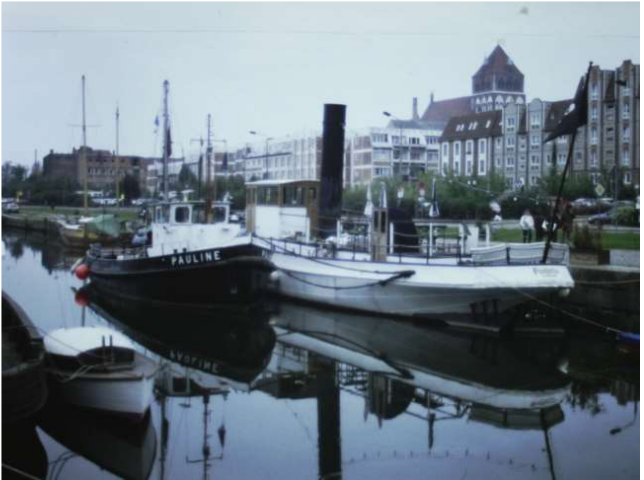
Abb . 4: Greifswalder Hafen mit Marienkirche (1979)