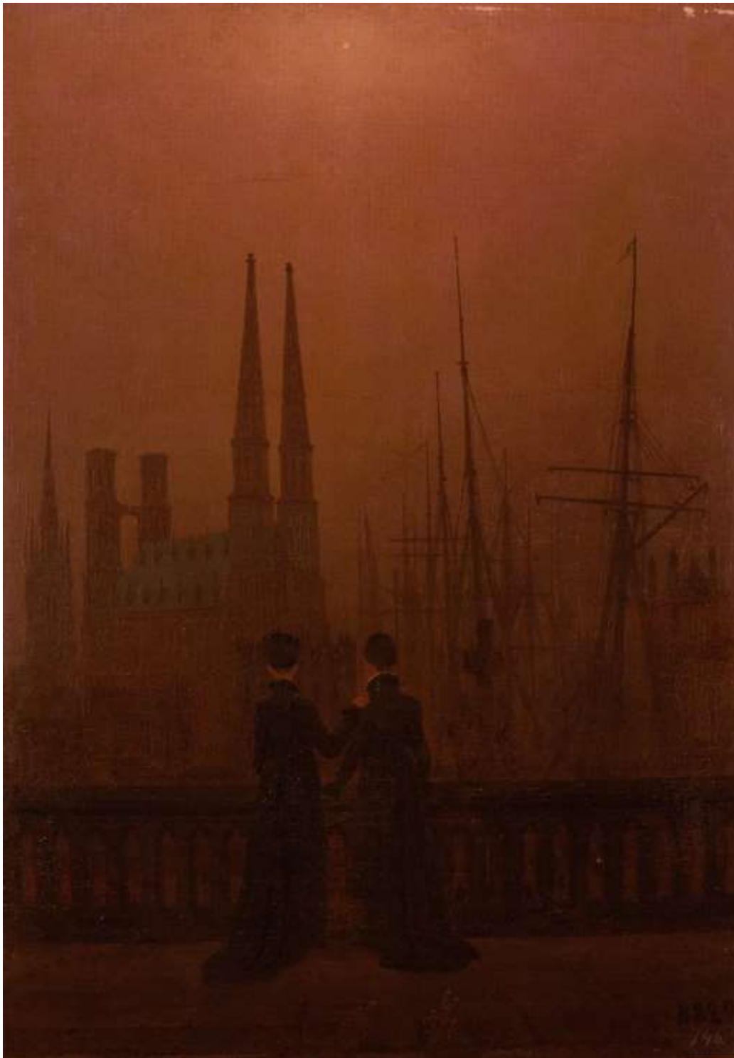
Abb. 1: Caspar David Friedrich, Die Schwestern auf dem Söller am Hafen

Öl auf Leinwand, 74 x 52 cm, Neue Eremitage in Sankt Petersburg , Inv. Nr. GE 9774. In: Antonia Isergina 1956, Zs. Bildende Kunst, Heft 5, S. 264 (mit Titel „Nächtlicher Hafen“), farbig in: Rewald 1991, S. 61