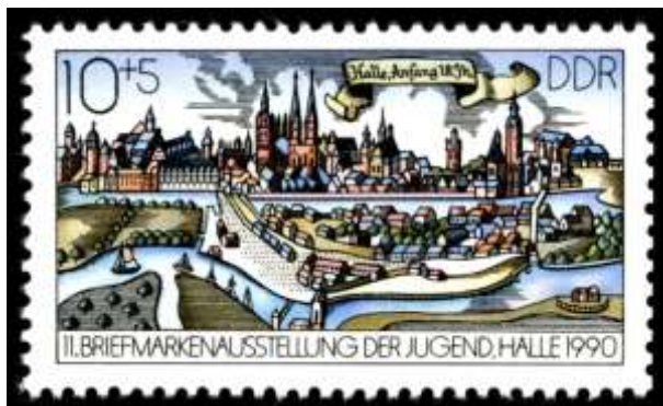
Abb . 14: Halle-Briefmarke von Joachim Rieß, Chemnitz (1990)

Abb. in: Müller-Bahlke/Zaunstöck 2009, S. 57 (Reproduktion Antje Langer)