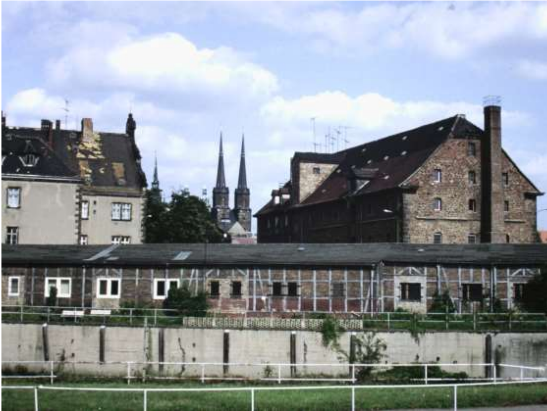
Abb. 9: Sicht auf die Fünf Türme vom früheren Ankerplatz an der Hulde (1994)