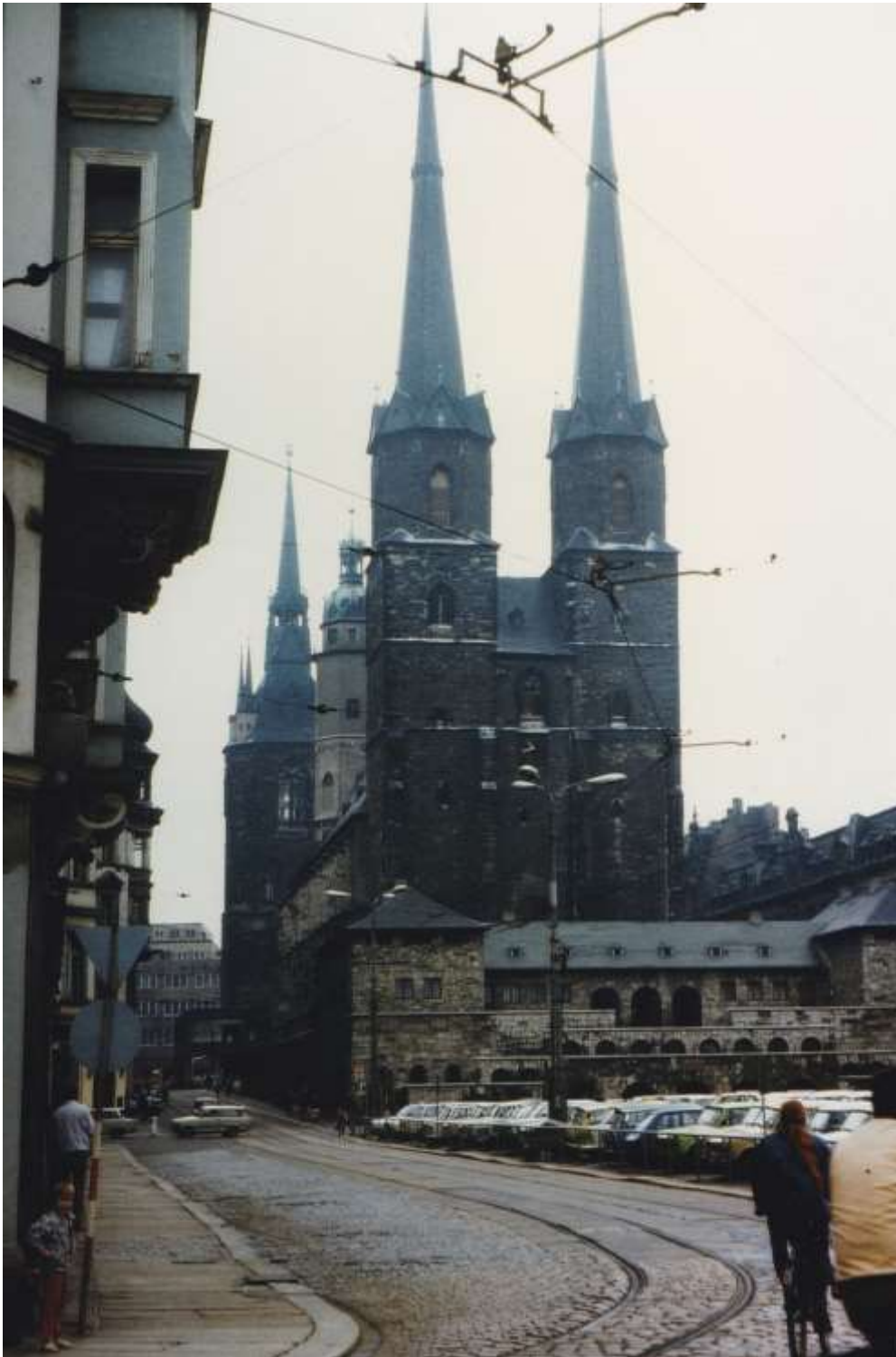
Abb. 5: Fünf Türme Halles, vom Hallmarkt (1988)