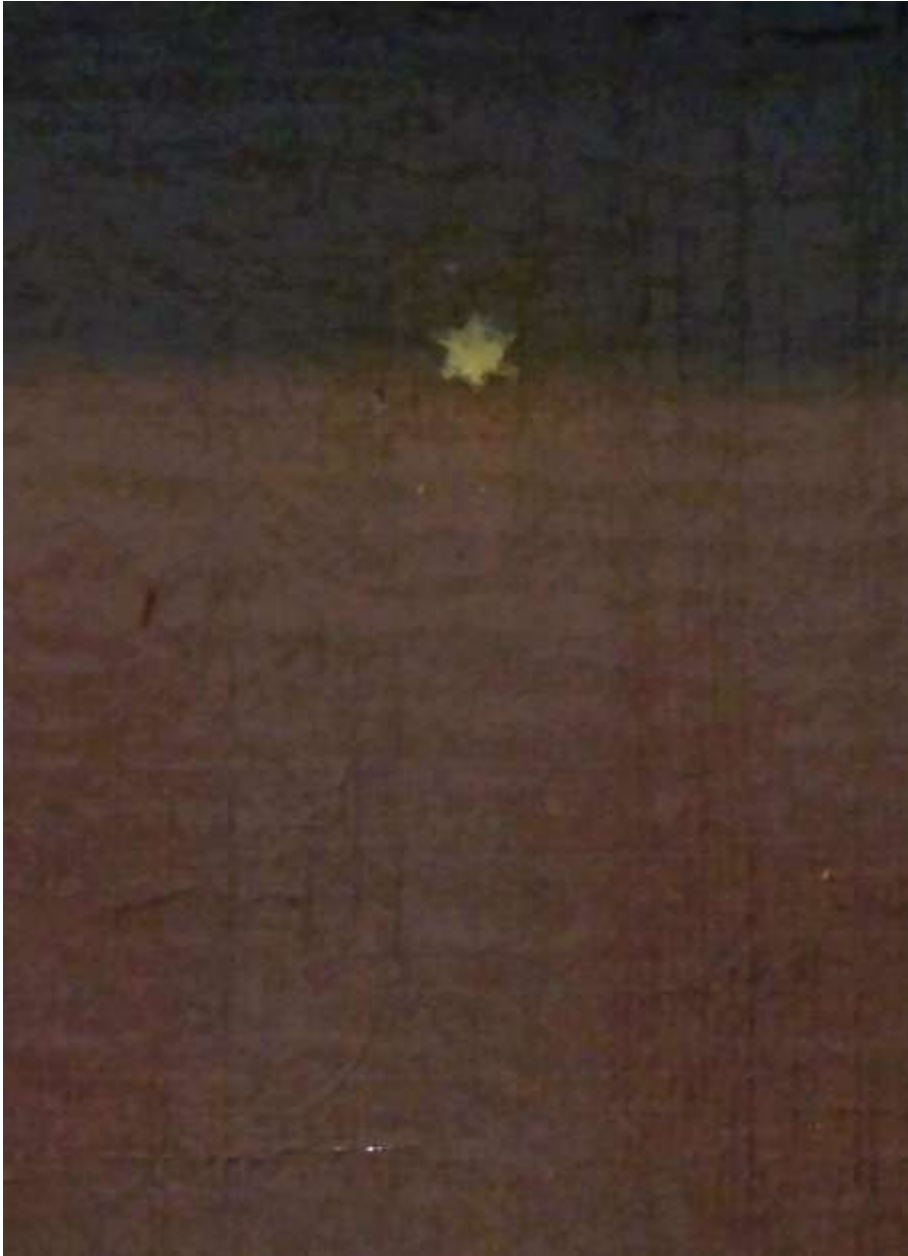
Abb. 27: Caspar David Friedrich, Die Schwestern auf dem Söller am Hafen Siehe Abb. 1, Det. Marienstern