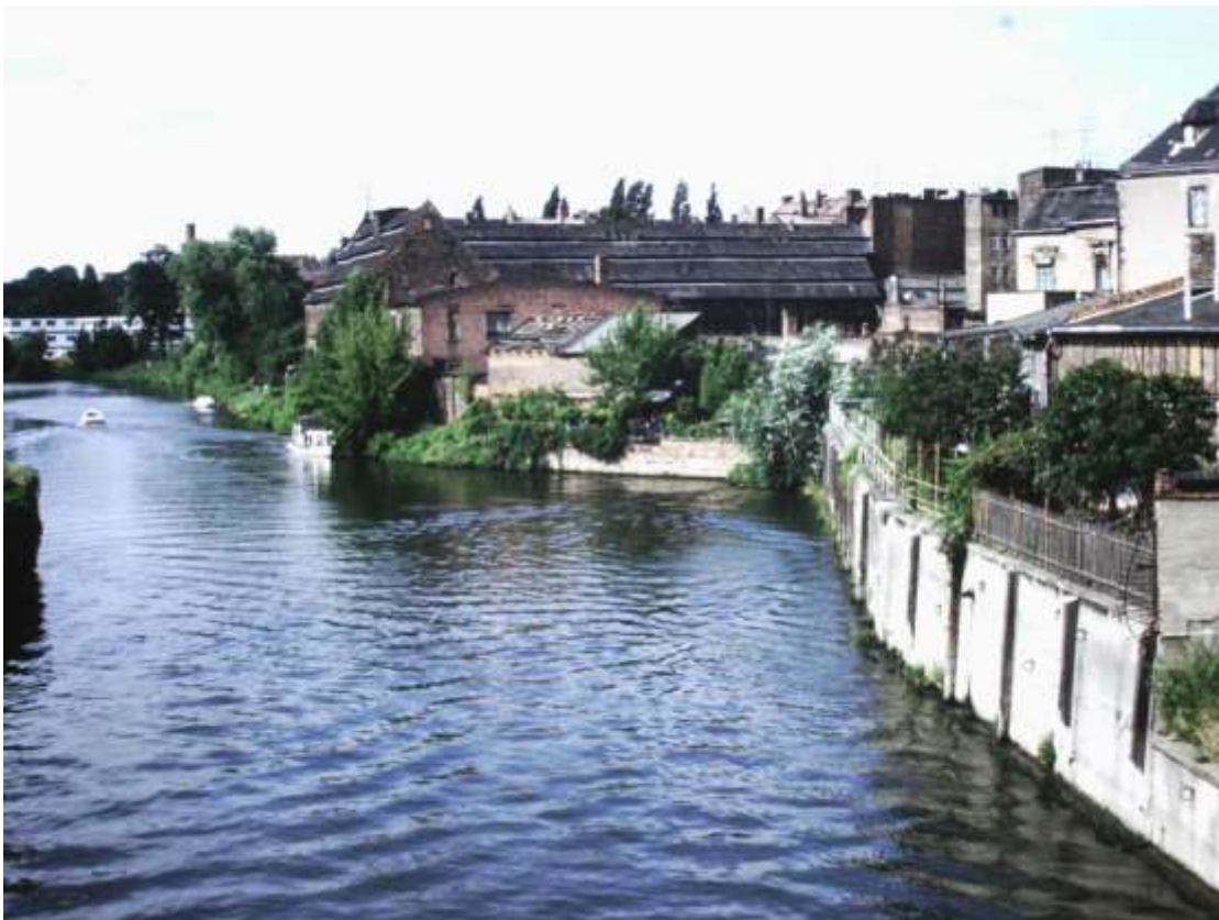
Abb . 10: Saale in Halle, früherer Ankerplatz an der Hulde (1994)