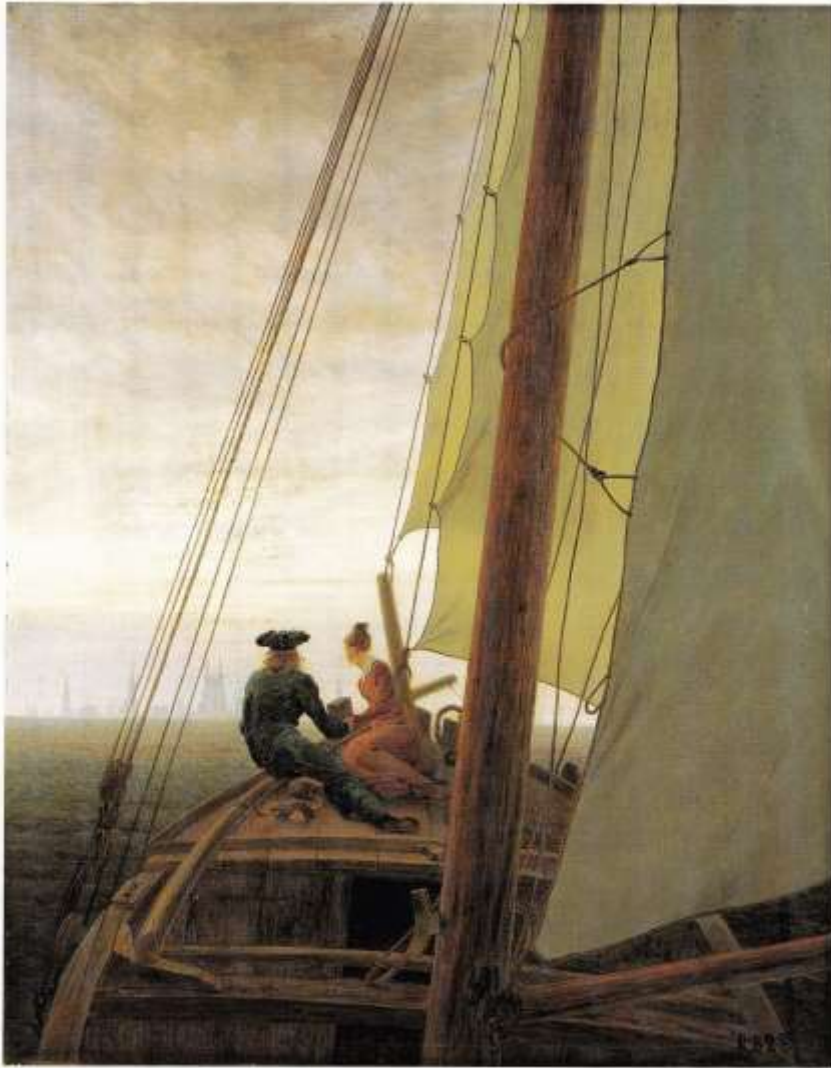
Abb. 31: Caspar David Friedrich, Auf dem Segler (1818/19)

Öl/Leinwand, 71 x 56 cm, Neue Eremitage, Sankt Petersburg, Inv. Nr. 9773. In: Rewald (1991), S. 57