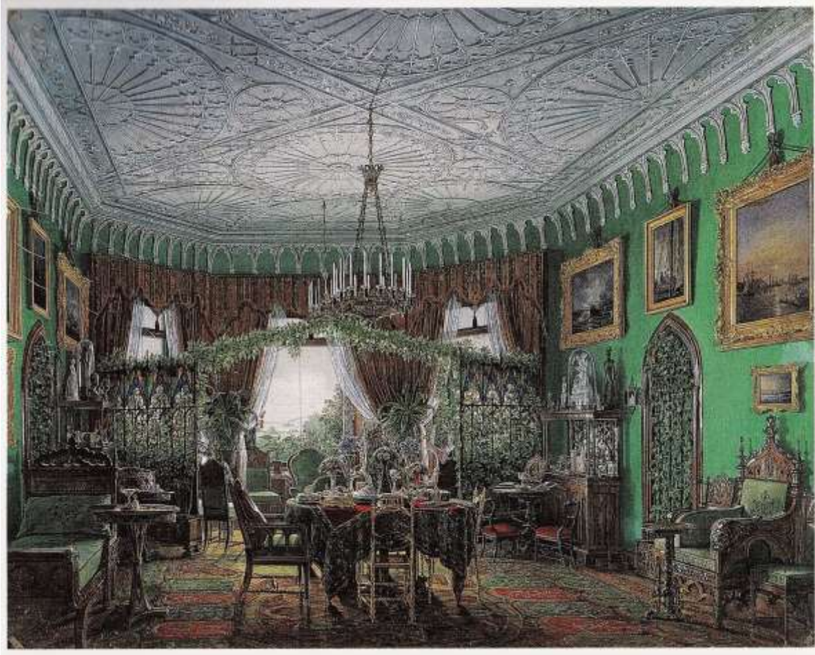
Abb. 30: Unbekannter Künstler, Zimmer im Englischen Cottage, Alexandria Park in Peterhof bei St. Petersburg (ca. 1840)

Aquarell, Neue Eremitage, Sankt Petersburg, in: Rewald (1991), S. 28