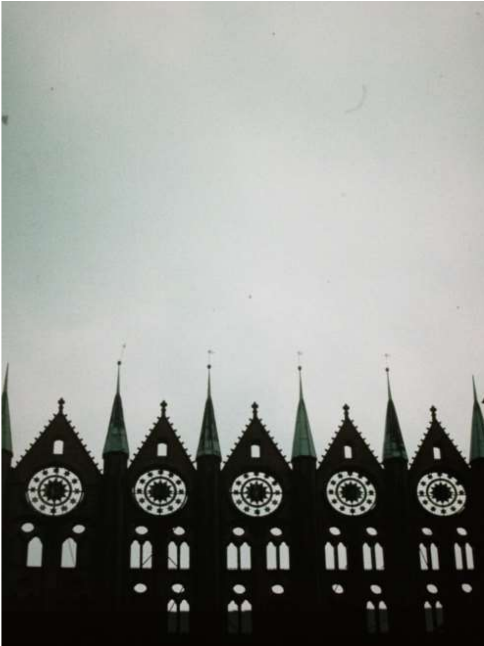
Abb. 16: Teilfassade des Stralsunder Rathauses