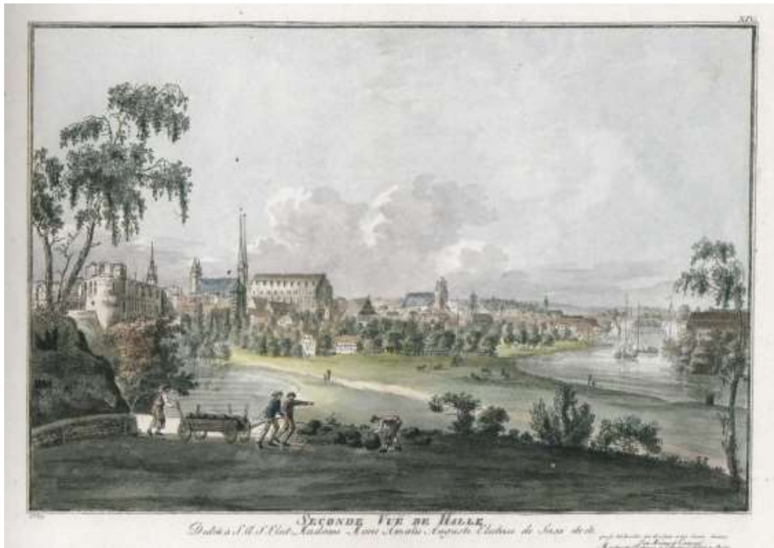
Abb . 12: Seconde Vue de Halle, altkolorierter Umrisskupferstich

Abb. in: Müller-Bahlke/Zaunstöck 2009, S. 57 (Reproduktion Antje Langer)