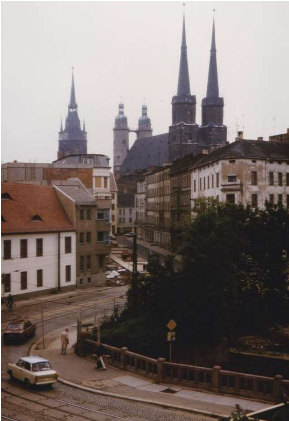
Abb. 6: Fünf Türme Halles, Eckhaus Mansfelder Str. 66, hinter der Klausbrücke (1988)