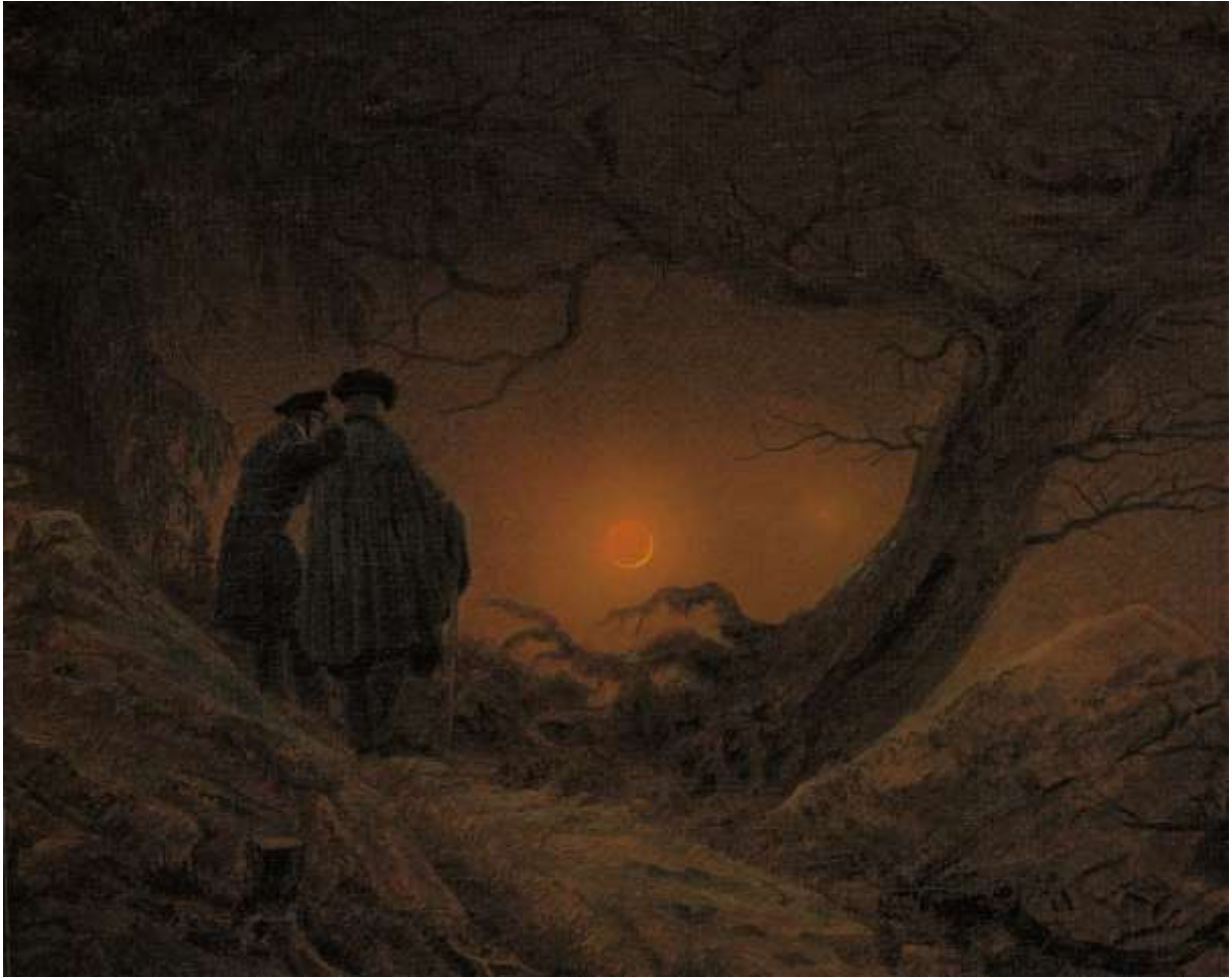
Abb. 21: Caspar David Friedrich, Zwei Männer in Betrachtung des Mondes (1819/20)

Öl/Leinwand, 35 x 44 cm, Dresden, Staatl. Kunstsammlungen, Gemäldegal.