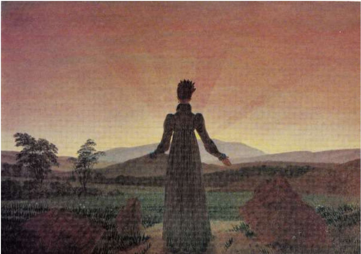
Abb. 22: Caspar David Friedrich, Frau in der Morgensonne (Frau vor der untergehenden Sonne; um 1818)